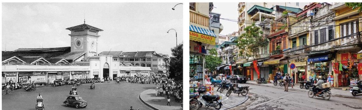
Hình ảnh Sài Gòn năm 1973 và Hình ảnh Một góc 36 Phở phường Hà Nội sau năm 1975